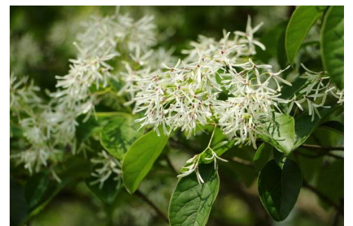
▲ なんじゃもんじゃの花

先生方、先輩方、同級生、後輩…たくさんの助産師と集う同窓会となりました。 次回の参加もお待ちしております。 ——名古屋大学助産学同窓会役員一同