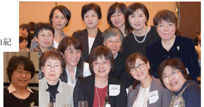
▲同窓会役員と協力者の方

◇ 保健学科の卒業生も同窓会役員として募集中です。 興味のある方は、同窓会メールアドレスまでご連絡ください。